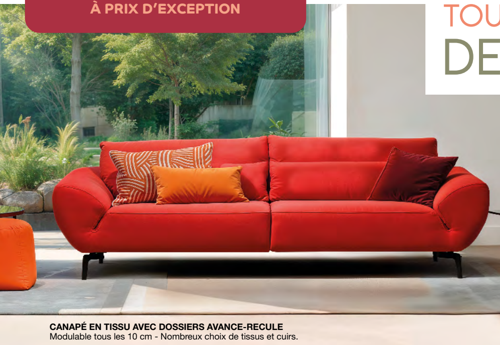
CANAPÉ EN TISSU AVEC DOSSIERS AVANCE-RECALE Modulable tous les 10 cm - Nombreux choix de tissus et cuirs.